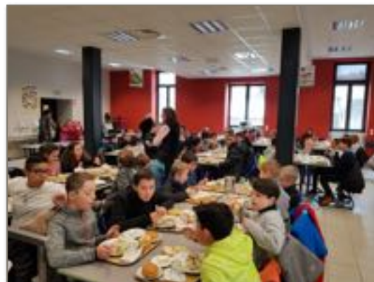
La Direction du Collège

A la fin de cette journée, dense mais riche en expérience, ces futurs collégiens ont retrouvé leur cadre familial, satisfaits et rassurés quant à leur arrivée future au collège à la prochaine rentrée.