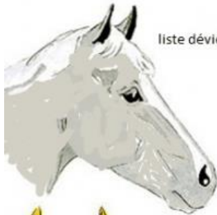
liste déviée a droite