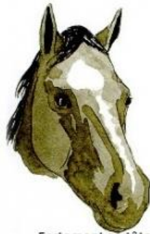
Fortement en tête liste déviée