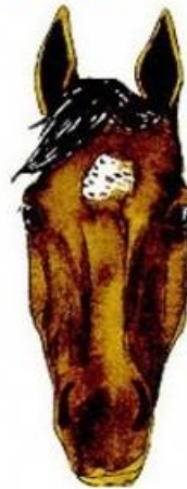
en tête herminée