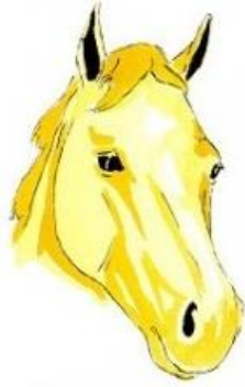
Etoile en tête liste interrompue