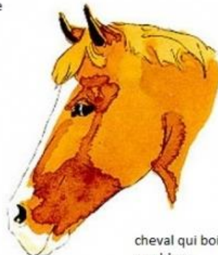
cheval qui boit dans son blanc