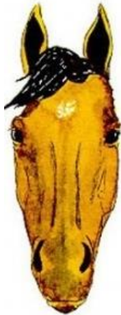
quelques poils en tête