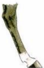
Grande balzane herminée