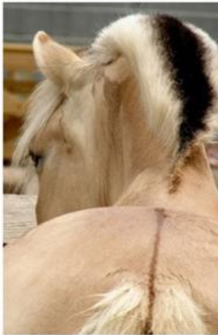
Raie de Mulet