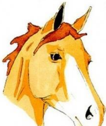
demi belle face