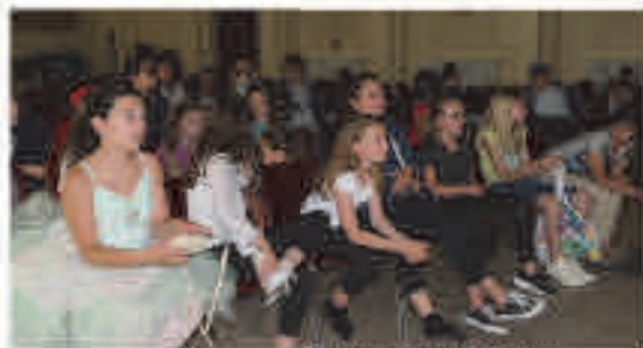
La troupe écoute les dernières consignes avant l'ultime répétition.

Dans le cadre de la fête de fin d'année scolaire, une manifestation nouvelle formule est proposée vendredi par le collège Saint-Joseph avec l'Estival des arts.