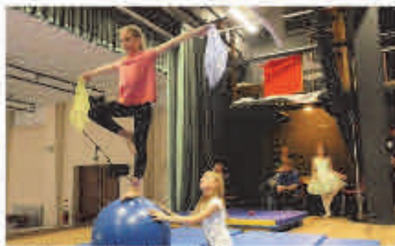
Souplesse, équilibre et concentration.